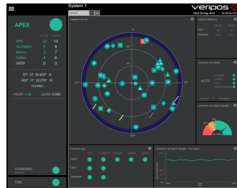
Pantalla de Quantum después de la configuración

Si los datos en las ventanas de Quantum no se llenan y los bordes parpadean en rojo, entonces el sistema LD8 no está conectado o la configuración es incorrecta. Si la configuración del LD8 es problemática, revise esta lista de problemas de configuración y orientación comunes: