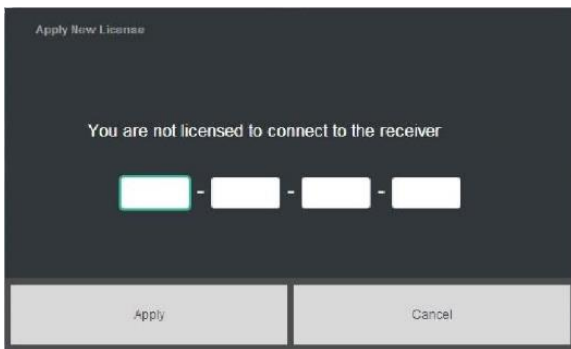
Solicitud de licencia de Quantum

La opción final de la configuración le permitirá elegir un nombre de configuración. Después dar clic en Save&Start . Se requiere una licencia para establecer la conectividad. Las licencias están disponibles en VERIPOS Helpdesk. Para obtener una licencia, indique el ID de la unidad LD5 de VERIPOS, el nombre del barco, la empresa y su número SAL.