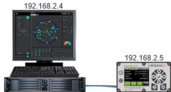
PC con Quantum y LD5 en la misma red

Una vez que el LD5 haya obtenido la configuración de red, inicie Quantum en la PC. En la página de Configuración del sistema, haga clic en New Configuration en la esquina derecha de abajo. Se cargará la página New Configuration Wizard: Receiver Configuration, en la opción Receiver Type debe seleccionar el tipo de receptor "LD5" e ingresar la IP del Receptor previamente configurada, como se muestra en la imagen de la derecha: